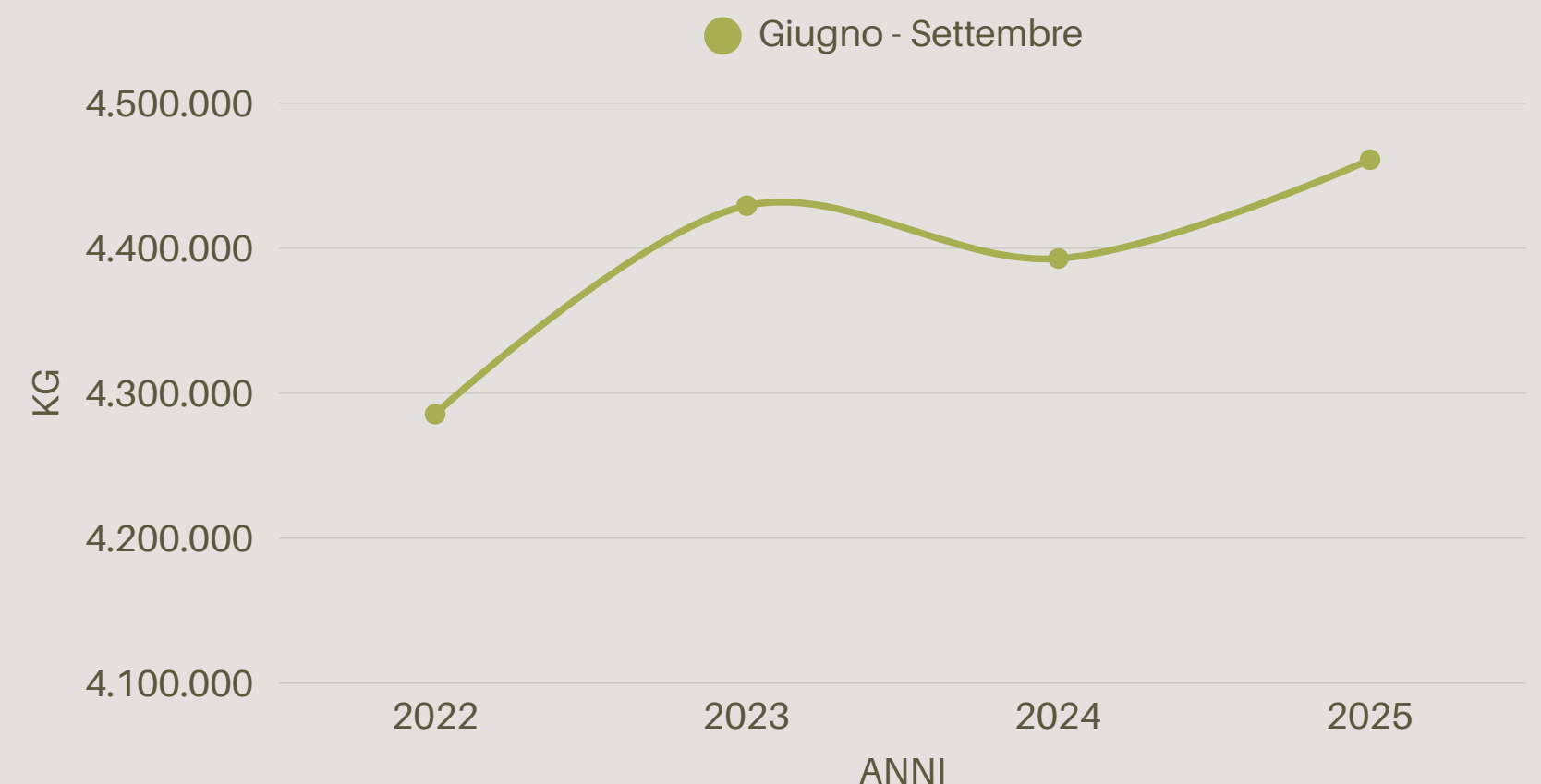
Andamento della produzione rifiuti urbani periodo giugno - settembre